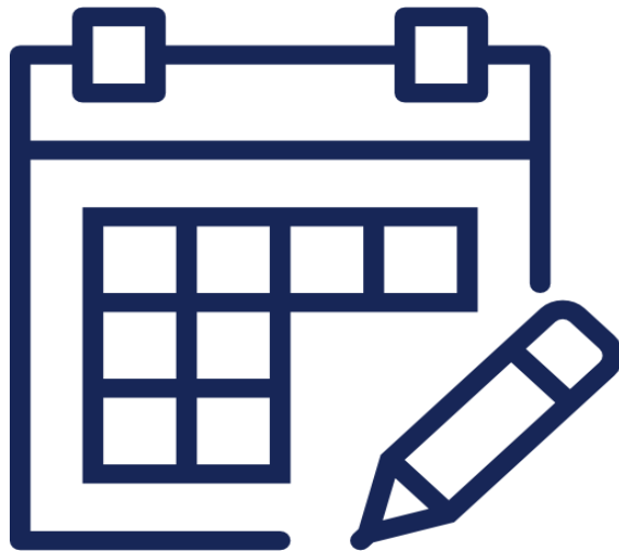
График проведения проверок формируется ежегодно